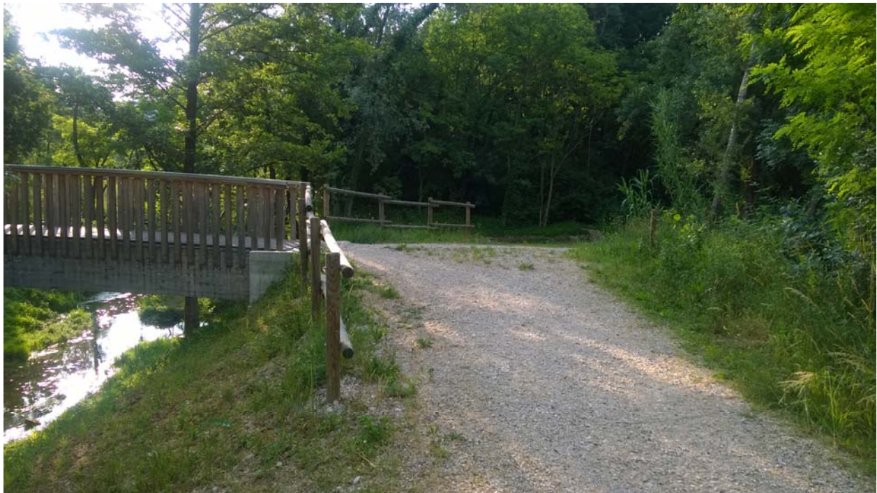
Percorso campestre (Curva a destra a 150 metri dall'arrivo)