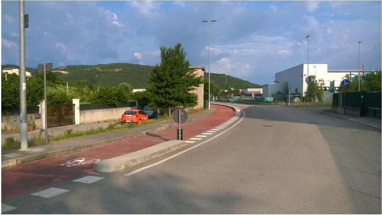
Zona parcheggio e pista ciclabile per riscaldamento