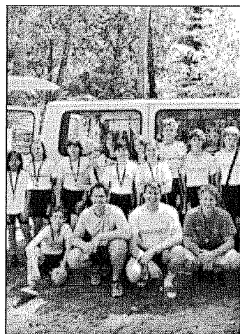
Esponenti della Pullino